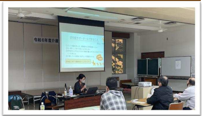
令和6年11月22日(金)介護労働安定センター

地域を対象とした認知症サポーター養成講座の依頼があった際には、圏域の地域包括支援センターにご相談いたしますので、その際にご協力の程よろしくお願いたします。