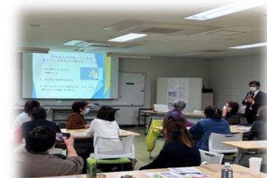
令和6年11月28日 老健ふじさわ

認知症施策推進大綱においては、令和7年までに全市町村で本人・家族のニーズと認知症サポーターを中心とした支援を繋ぐ仕組み（チームオレンジ）を整備することが掲げられています。今年度は、当センターに所属するオレンジ・チューターが各市町村や地域包括支援センターを訪問し、チームオレンジに係る支援を実施しました。